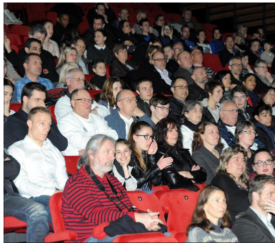
■ Près de 400 personnes sont venues hier soir à l'Arsenal pour applaudir les sportifs.